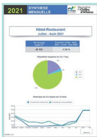
Synthèse mensuelle Juillet-Août 2021

Nous vous invitons à consulter notre site internet, www.oga-ca.bzh , sur lequel vous avez accès à toutes ces informations (rubrique Statistiques). Le millésime 2020 y est disponible.